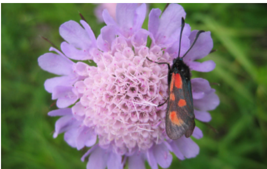
Blutströpfchen auf Witwenblume