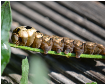
Raupe Mittlerer Weinschwärmer

Hasel ( Corylus avellana ) Liguster ( Ligustrum vulgare ) Geißblattarten ( Lonicera spp. ) Weidenarten ( Salix spp. ) Holunder ( Sambucus niger ) Schneeballarten ( Viburnum spp. )